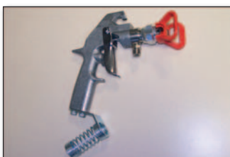
Graco Airless Farb- Handspritzpistole

(U): Umkehrdüse (Drehdüse): für eher kleine Farbmengen; komfortable Reinigung