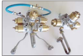
Airless 2K-Spritzpistole und Doppel-Spritzpistole