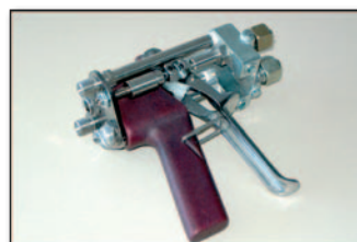
Airless 2K Handspritzpistole