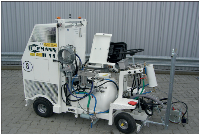
Servicefreundliche H11-1: sehr guter Zugang ...