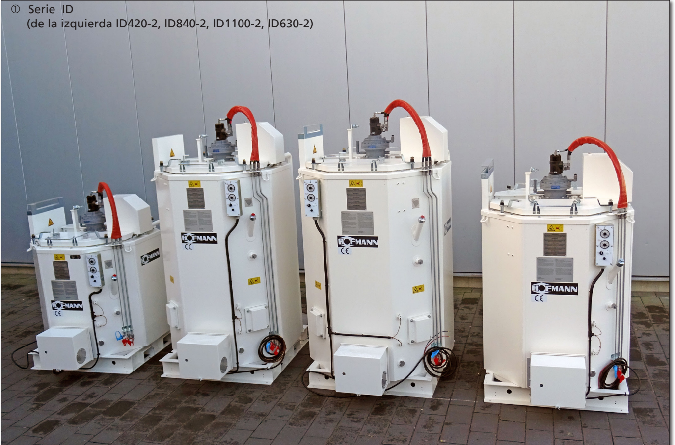
① Serie ID (de la izquierda ID420-2, ID840-2, ID1100-2, ID630-2)