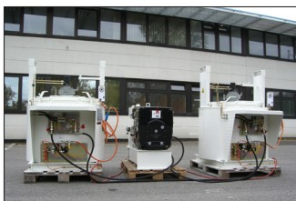
② ID100 Unidad de caldera + estación energética compacta y transportable - sin juntas que estén en contacto con el material - alto par de giro del agitador hidráulico - sólo con quemador de gas propano, estación energética de 3,1 kW